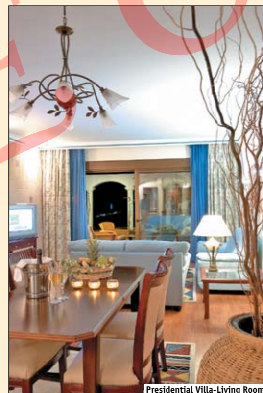
Presidential Villa-Living Room